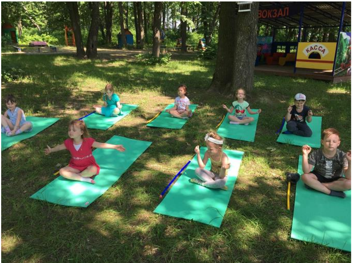
Йога на свежем воздухе