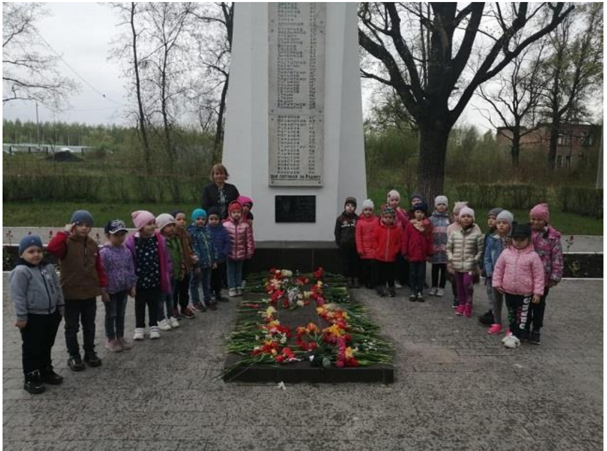
Возложение цветов к памятнику Неизвестному солдату